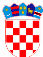
Republika Hrvatska Centar za socijalnu skrb Šibenik

zaželi! Program zapošljavanja žena UP.02.1.1.05.0317